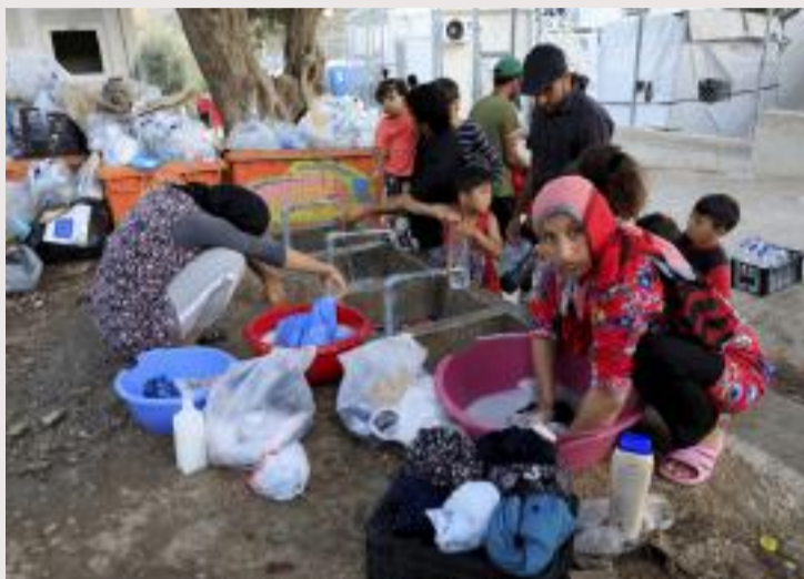
Migranter vasker klær i et flyktningleir på øya Lesbos i Hellas.

Den frie mobiliteten av arbeidskraft innenfor EU illustrerer noen dilemmaer. Stater som er politisk ustabile og/eller autoritære, kan være mot internasjonal migrasjon, men ikke fordi de er for en demokratisk mobilisering av borgere for det felles gode.